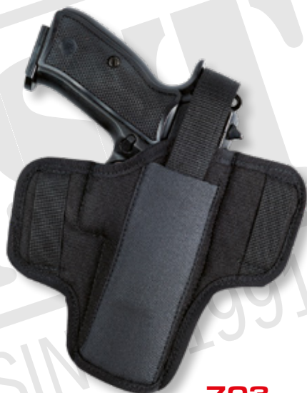
703 Pi CZ 75/85, CZ 75 SP-01, BERETTA 92