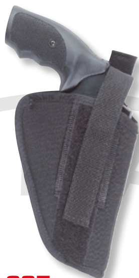
627 revolver 4"