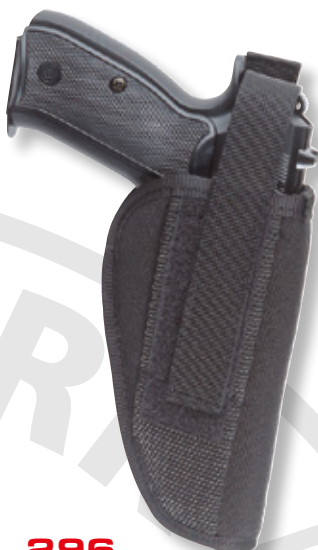
296 Pi CZ 75/85, Colt M1911 BROWNING GP DA9